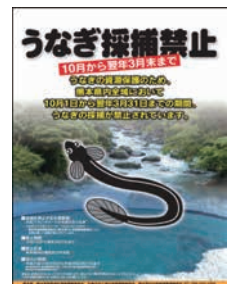
ウナギ資源保護のため、熊本県が製作したポスター

産卵海域に向かうウナギを増やすため、河川から海に下る時期のウナギ漁を禁止する取組等を進めています。