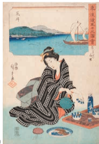
歌川広重「東海道五十三図会 廿二 荒井 名ぶつ蒲焼」 弘化4年～嘉永5年(1847～52)