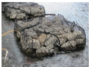
ウナギのすみかの整備